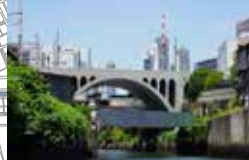
聖橋 丸ノ内線の鉄橋を 前景に望む聖橋