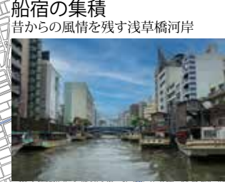
船宿の集積 昔からの風情を残す浅草橋河岸