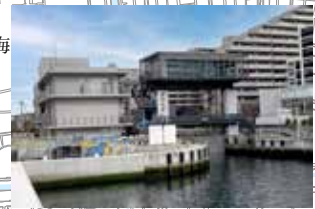
扇橋閘門 閘門の通過で海 抜差を体験

※開催日の前日に、実施の有無をメールにて配信します。 (watercitytokyo@gmail.com より配信) ※天候、潮位、その他突発の事情に伴う安全確保のため、使用船の変更、やむを得ず航路、航行時間が変更になる場合があります。あらかじめご承知おき下さい。 ※快適なクルージングをお楽しみ頂くため、船内ではアルコール類及びおタバコは控えて下さい。