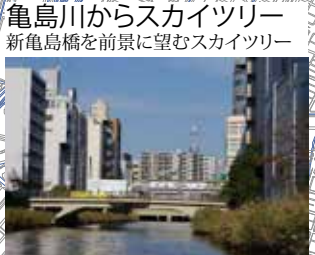
亀島川からスカイツリー 新亀島橋を前景に望むスカイツリー