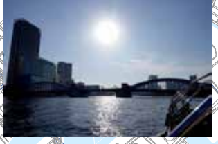
勝鬨橋 逆光に映える勝鬨橋のシルエット